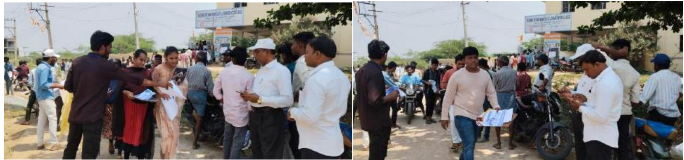
At VR Jr College, Mydukur on 5th March, 2025