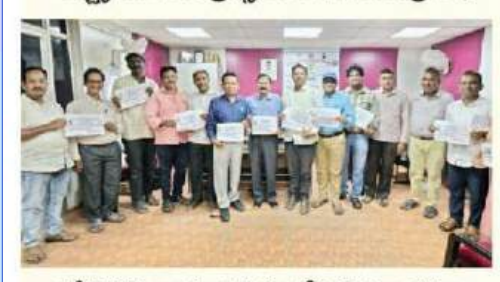
పలీక్ష కరపత్రాలను విడుదల చేస్తున్న అధ్యాపకులు

- ఆర్ట్స్ కళాశాల ప్రిన్సిపల్ డా.జీ రవీంద్రనాథ్