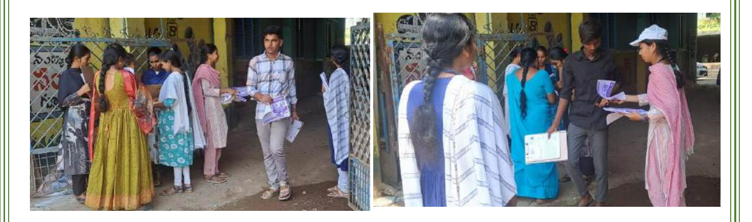
At Pragathi Jr College, Mydukur on 5<sup>th</sup> March, 2025