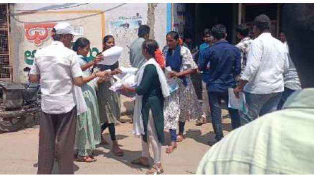
At Medha Jr College, Mydukur on 5<sup>th</sup> March, 2025