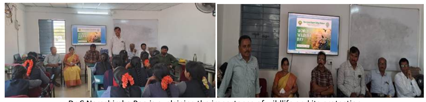
Dr C Narashimha Rao is explaining the importance of wildlife and its protection

"Invest in nature today for a sustainable tomorrow"