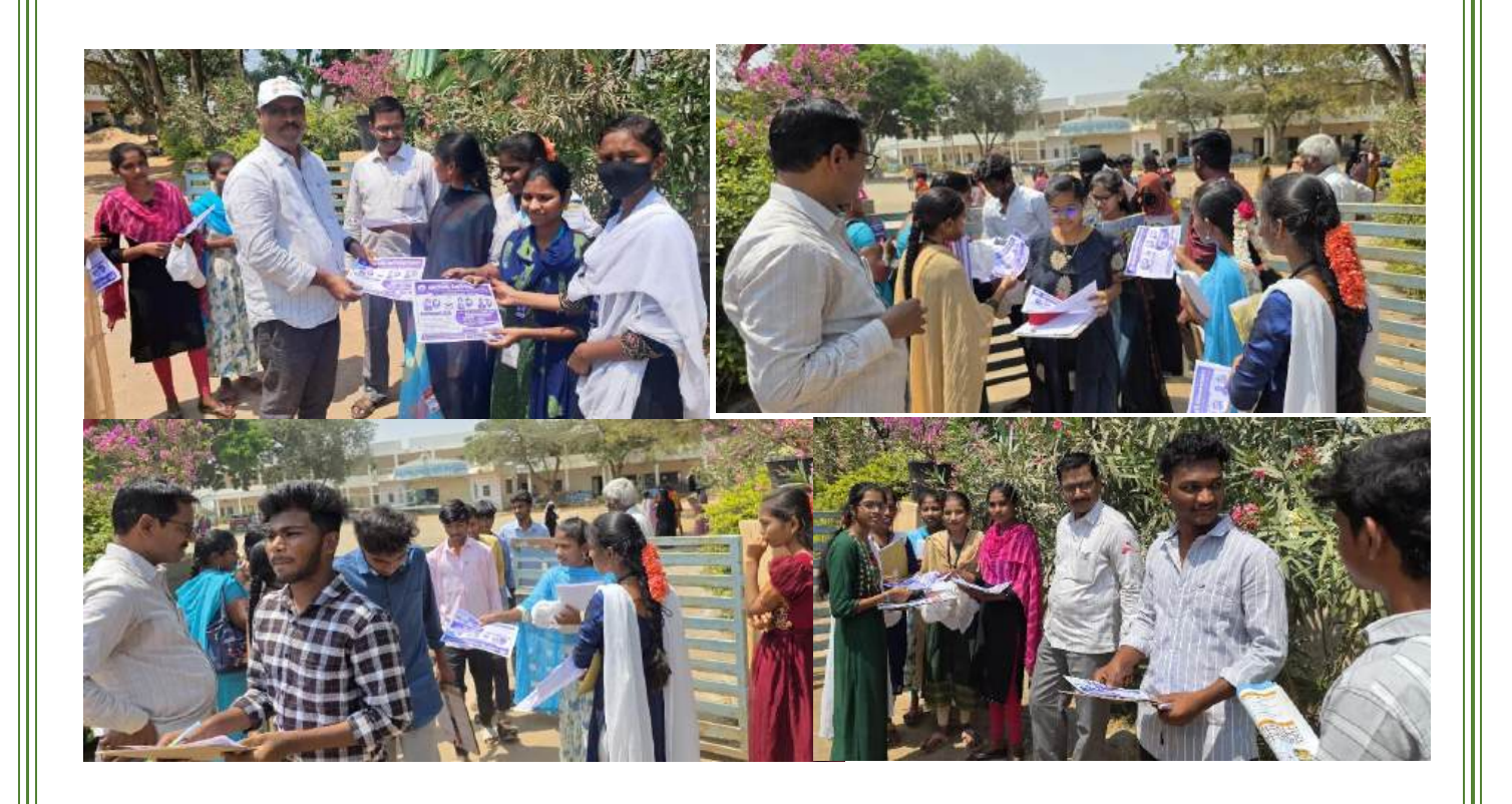
At RES Jr College, Mydukur on 5<sup>th</sup> March, 2025