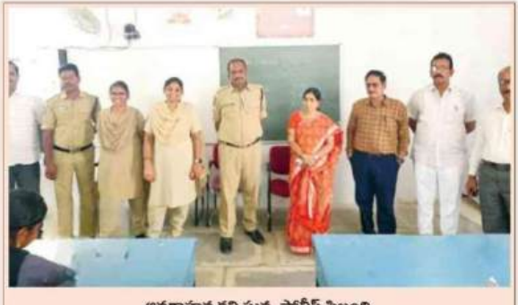
అవగాహన కర్పిస్తున్న పోలీస్ సిబ్బంబి